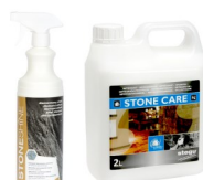
STONE SHINE / STONE CARE