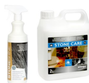
STONE SHINE / STONE CARE