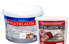
MULTIELASTIK / POWERELASTIK